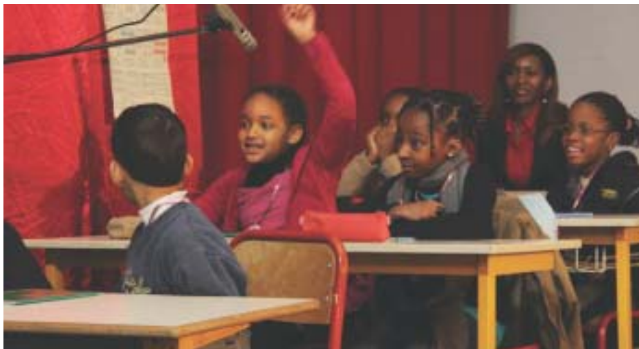
Sketch des enfants "Décris-moi ton école"