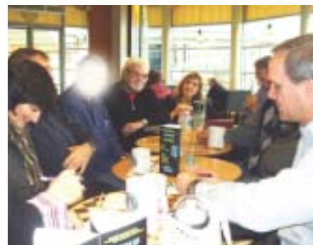
Petit déjeuner de travail