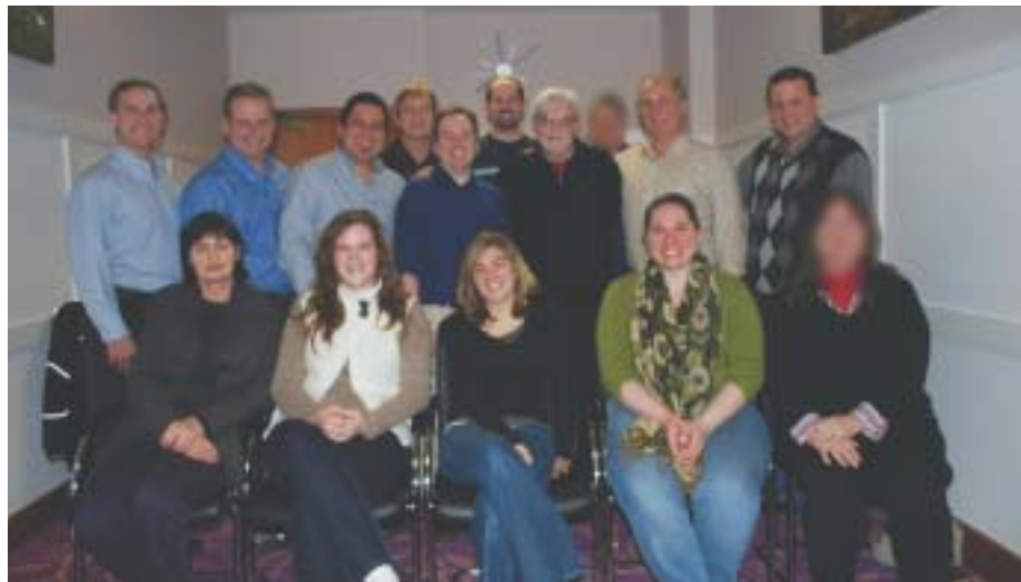
Les leaders Horizon Europe